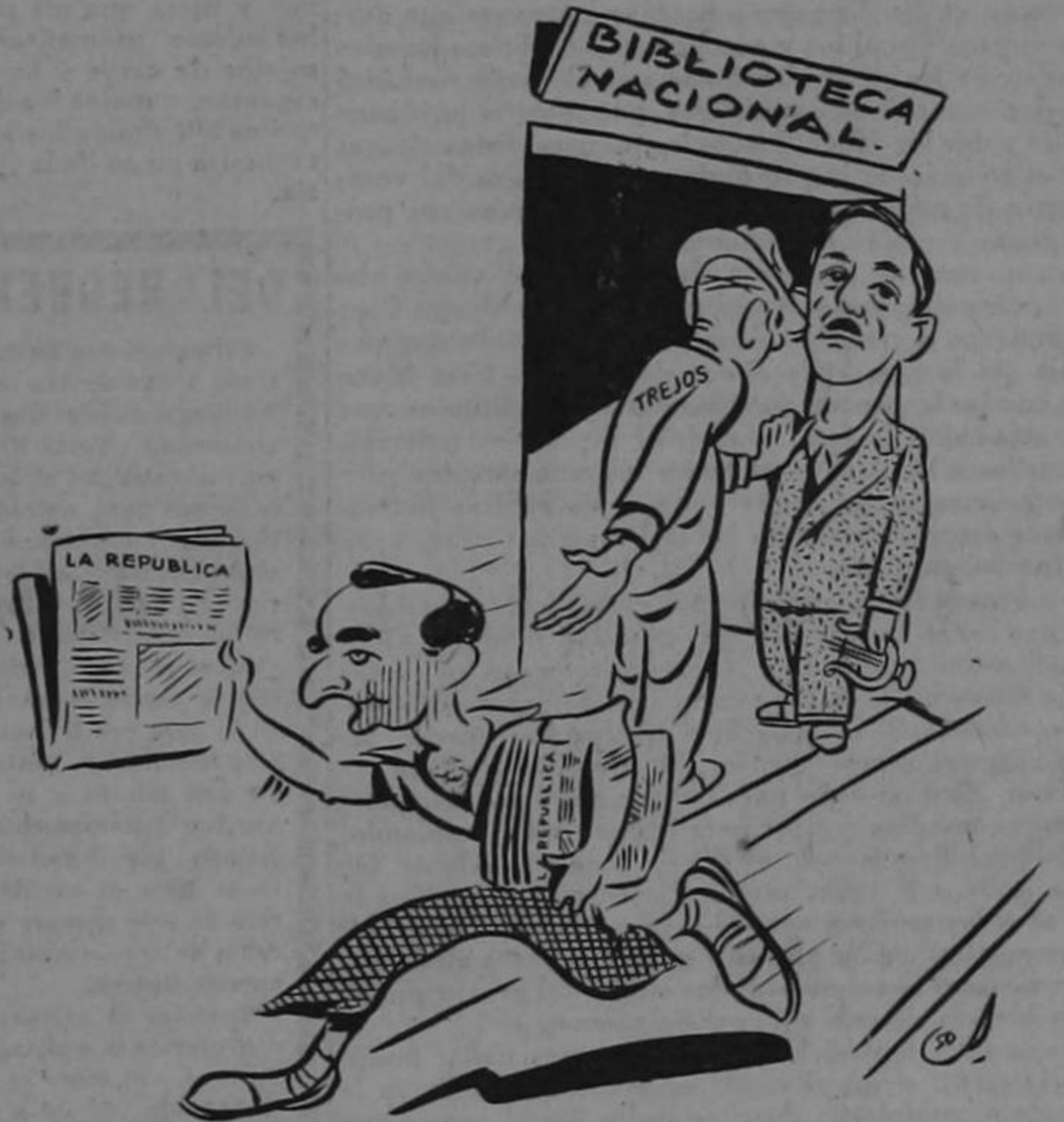
POR LO QUE VEMOS, DON PEPE QUIERE "LA REPUBLICA..."